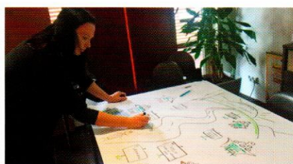
Työskentelyä korkeakoulutuksen polulla.

teemoina ovat esimerkiksi osaamisen hankkimisen henkilökohtaisuus ja tulevaisuusorientaatio, opiskelijoiden yksilölliset tarpeet huomioi-