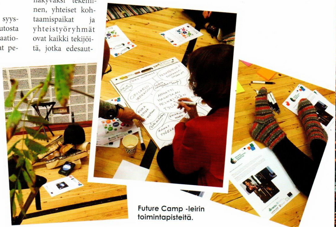
Future Camp -leirin toimintapisteitä.

Lapin ammattikorkeakoulu ja Lapin yliopisto ovat osallistuneet hankkeen aikana erityisesti Korkeakoulutus-polun suunnitteluun ja opiskelijapilotointiin yhteistyössä Lapin koulutuskeskus REDU:n kanssa. Vuodesta 2017 Lapin AMK:ssa on ollut tarjolla Lapin koulutuskeskus REDU:n, Lappian ja Saamelaisalueen koulutuskeskuksen ammatillisen koulutuksen opiskelijoille maksuttomia 30 opintopisteen eri koulutusten väyläopintopaketteja avoimina ammattikorkeakouluopintoina. Väyläopinnoista on nyt muutaman vuoden kokemus ja opiskelijoilta on kerätty palautetta jatkokehittämistä varten.