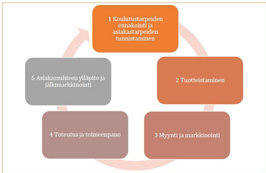
Kuvio 2 Lappilainen koulutuskumppanuus -toimintamalli (Kangastie, Koski ja Pruikkonen 2012, 94)

Koulutuskumppanuutta ohjaavalla toimintamallilla varmistetaan yhtenäiset toimintatavat, toiminnan laatu sekä yhteistyön jatkuvuus. Kuviossa kaksi on avattu Lappilainen koulutuskumppanuus -toimintamallia.