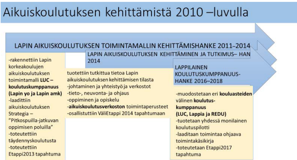
Kuvio 1 Aikuiskoulutuksen kehittämistä 2010-luvulla Lapissa. (Kangastie 2017)

Yhteistyömuodoiksi sovittiin seuraavat alueet: koulutusyhteistyö, ennakointitiedon, asiantuntijuuden ja osaamisen jakaminen, tutkimus-, kehittämis- ja innovaatioyhteistyö ja sen kehittäminen ja työelämäpalveluiden yhteiskehittäminen. Kuviossa yksi on avattu koulutuskumppanuuden rakentumista osana aikuiskoulutuksen kehittämistä 2010-luvulla.