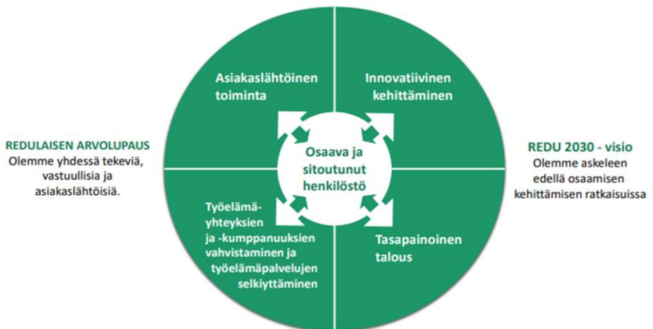
KUVA 4. REDUn arvolutaus, visio 2030 ja strategiset kehittämisen painopistealueet 2021-2023

Nämä painopistealueet on johdettu REDUn strategia 2030:n arvolutauksesta ja visiosta.