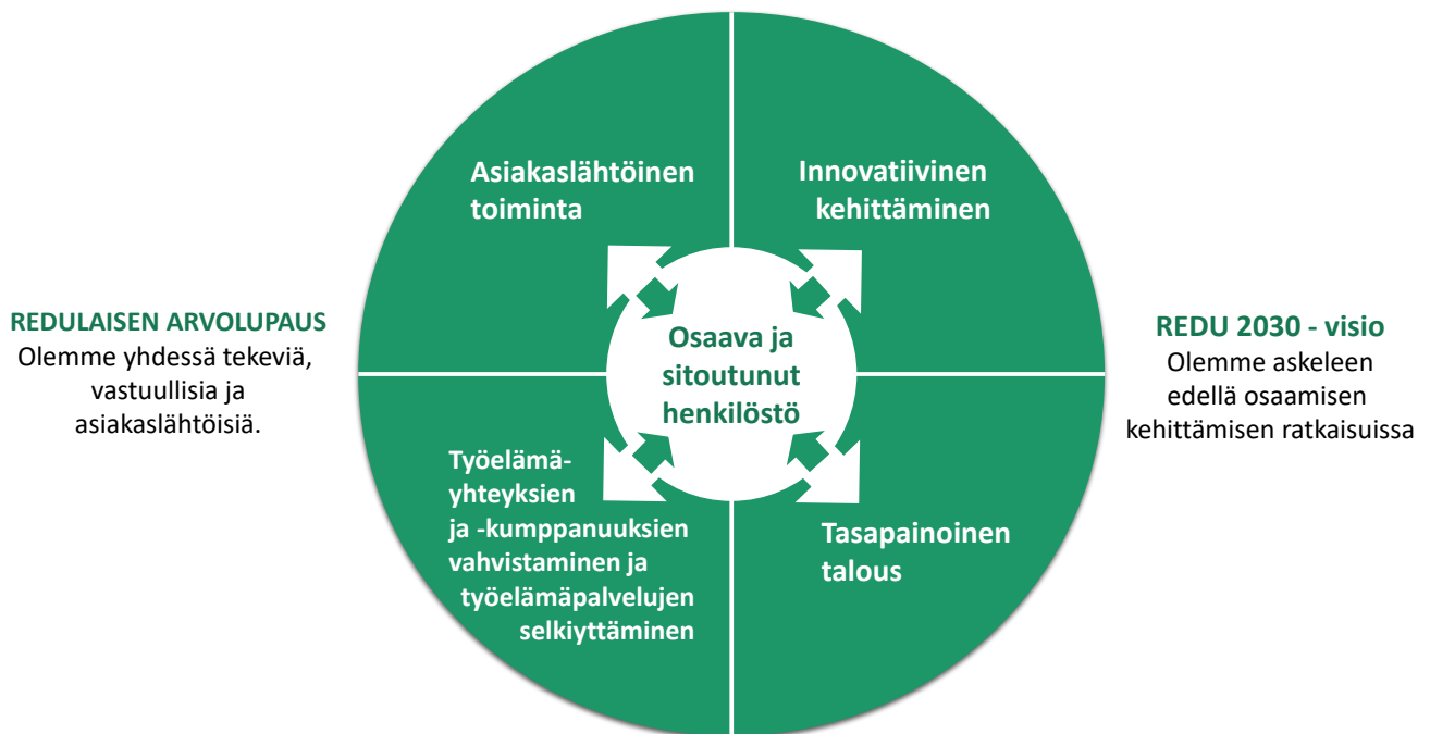
KUVA 2. REDUn arvolupaus, visio 2030 ja strategiset kehittämisen painopistealueet 2021-2023

Seuraavilla sivuilla olevissa taulukoissa 1–5 on esitetty painopistealueittain toimintavuoden 2022 sitovat tavoitteet sekä niihin toteuttamiseen liittyvät keskeisimmät riskit.