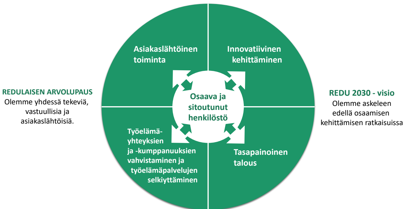
KUVA 2. REDUn arvolupaus, visio 2030 ja strategiset kehittämisen painopistealueet 2021-2023

Seuraavilla sivuilla olevissa taulukoissa 1–5 on esitetty painopistealueittain toimintavuoden 2021 sitovat tavoitteet sekä niihin toteuttamiseen liittyvät keskeisimmät riskit.